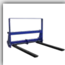
Fourche à palette